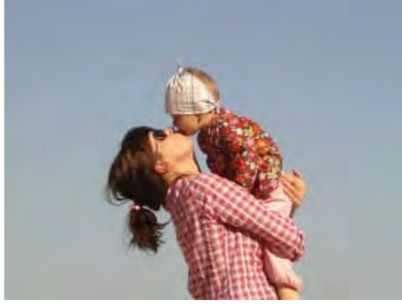
Resim 3.2: Sevgi; insanları birbirine yaklařtıran olumlu ve iyi duyguların tümüdür.

Hatalı çocuk yetiřtirme tutumlarının sonucunda, çocuęun sevme anlayıřı, gerçeęinden sapar: “Yemeęini yersen seni çok severim, okulda uslu çocuk olursan öęretmenin seni çok sever”. Bu sevgi kořullu sevgidir. Çocuk kořullu sevgiyi anne babasından öęrenir. Çocuęu gereksindięi sevgiyle tehdit etmek, anne ve babanın çocuklarının hayatları için yaptıkları en büyük hatadır.