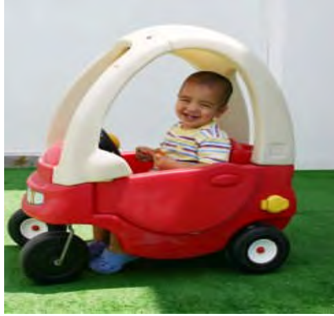
Resim 3.5: Oyuncaklar göze hoş görünmelidir.

Oyun; çocuğa kurallara uymayı, sorumluluk almayı, iş birliğini ve diğer insanlara saygılı olmayı öğretir. Ayrıca girişimci olma, tehlikeyi göze alma, karar verme ve problem çözme yeteneğinin gelişmesine yardımcı olan önemli bir unsurdur. Bunların yanı sıra oyun çocuğun kendisine güvenini geliştirme, duygusal ve sosyal ihtiyaçlarını karşılamada, kendi kendine yeterli olabilme gibi nitelikler kazandırır.