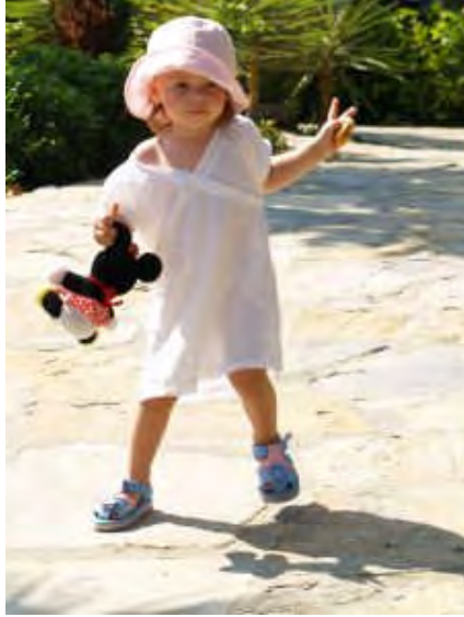
Resim 3.1: Çocukların kendilerine güvenebilmeleri için anne babasız hareket edebilecekleri güvenli, geniş alanlara ihtiyaçları vardır.