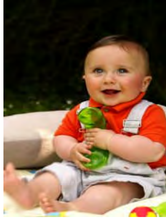
Resim 3.6: Oyuncaklar dayanıklı olmalıdır.

Okul öncesi dönemde çocukların oyuncaklara ve oyun materyallerine karşı olan bu ilgilerinin yanı sıra, artan bir yaratıcılık, yetiştikine benzeme ve taklit çabası da vardır. Bu noktada anne babaya düşen en büyük görev, alıcı ve öğrenmeye hazır olan çocuğa uygun oyuncakların sunumudur. Anne baba bu dönemde, çocuğun gelişim özelliklerine uygun, ihtiyaç duyduğu ortamı ve materyalleri sağlamaktan sorumludur. Bu dönemde anne babalar tarafından üzerinde önemle durulması gereken bir başka konu da çocukların gelişimlerine katkısı olmayan pahalı ve süslü oyuncakların yerine yaşlarına ve gelişim düzeylerine uygun, uyarıcı ve düşündürücü oyuncakların tercih edilmesidir. Yine bu dönemde yetişkinler çocuklarına gereğinden fazla oyuncak alarak, onların tüm gereksinimlerine cevap vereceklerine inanırlar. Önemli olan oyuncakların çokluğu değil nitelikli olmasıdır.