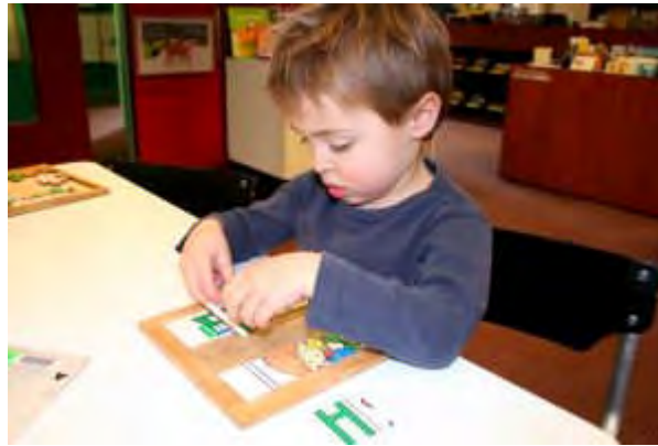
Resim 3.3: Oyun çocuğun en ciddi uğraşdır.

Oyunun tanımı konusunda eski zamanlardan beri çeşitli görüşler öne sürülmüştür. Tüm bu görüşlerin ortak yönü, büyük düşünür Montaigne’ nin belirttiği gibi, çocukların oyunu oyun değil, onların en ciddi uğraşdır” şeklinde özetlenebilir.