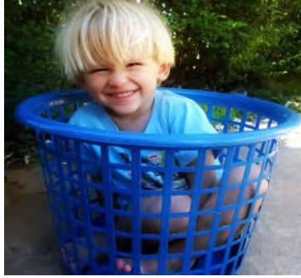
Resim 3.4: Çocuk oyun yoluyla bedenini ve nesnelerin özelliklerini tanımaya çalışır.

Bebek ve çocukların gelişim sırasında olgunlaşma ve sosyal boyutun erken gelişmesinde oyunun önemi belirgindir. Ayrıca içinde yaşanılan kültürün önemli etkilerinden olan araştırma duygusunun ve kurallara uymanın öğrenildiği ve geliştirildiği yer de oyunlardır.